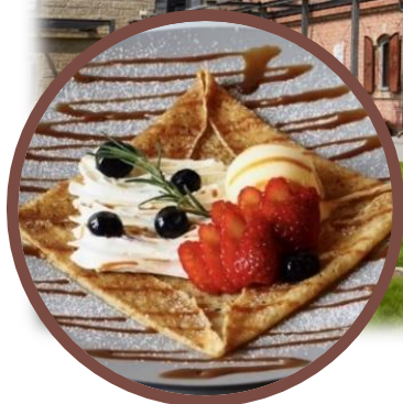
「富岡クレープ」と ドリンク付き