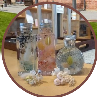
メルシー・ココン&カフェにて まゆ玉入りハーバリウム体験