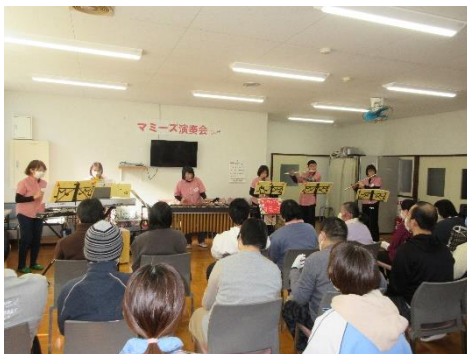
第3回社会参加研修 マミーズ演奏会