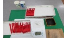
シャープペン組み立て