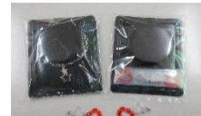
アクセサリ袋詰め